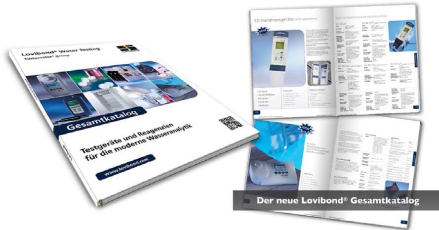
Der neue Lovibond® Gesamtkatalog

Auf 140 Seiten finden Sie Testgeräte und Reagenzien für die moderne Wasseranalytik.